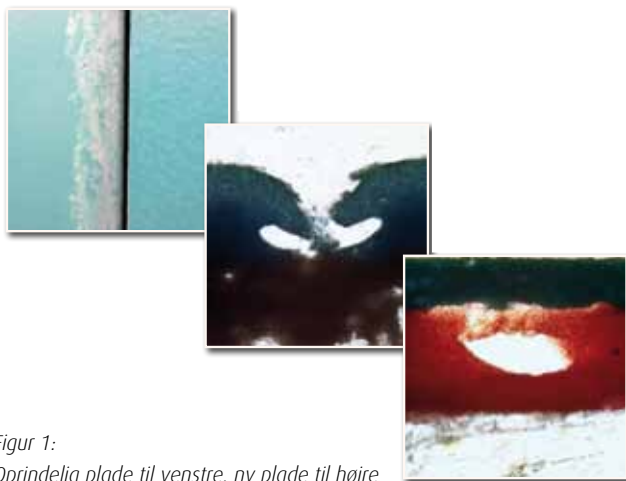
Figur 1: Oprindelig plade til venstre, ny plade til højre

Hvide udfældninger blev observeret på blåmalede fiberbetonplader. Nogle af pladerne blev udskiftet med nye plader, der ifølge oplysning skulle være identiske med de oprindelige plader. Det viser sig dog, at der ikke umiddelbart kommer udfældninger på de nye plader